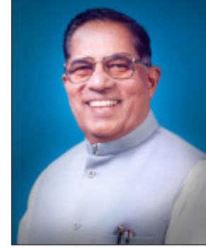
स्व.जयवंतराव भोसले (आप्पा)