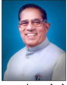
स्व.जयवंतराव भोसले (आप्पा)